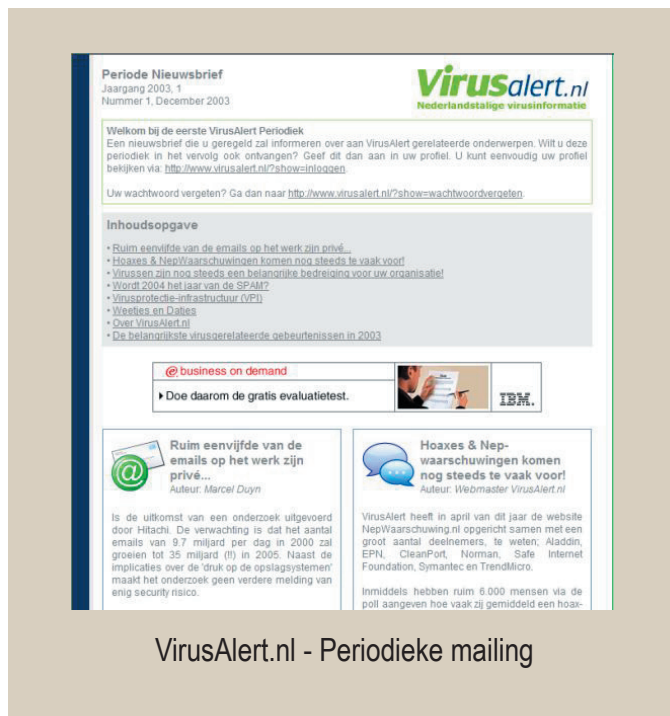
VirusAlert.nl - Periodieke mailing